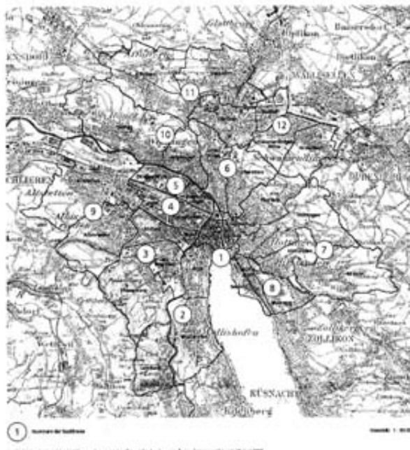
Stadtkreise und Quartiere der Stadt Zürich

ten überwiegen, finden sich bürgerlich-traditionelle Lebensformen mit der klassischen Rollenverteilung bei der Erziehung vor allem an den Agglomerationsrändern.